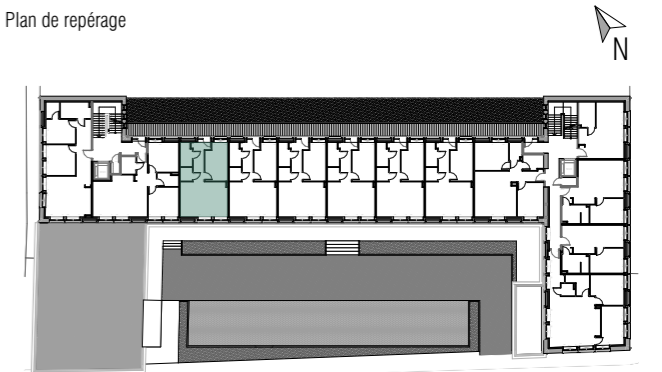
Plan de repérage

Document non contractuel. Des modifications ultérieures sont susceptibles d'être apportées à ce plan en fonction des nécessités techniques, réglementaires ou administratives à la réalisation, tant en ce qui concerne les dimensions libres que l'équipement. Les surfaces et hauteurs sous plafond indiquées sont approximatives. Les retombées, soffites, gaines techniques, canalisations, trappe de visite, descentes d'eau de pluie, d'eau vanne ou équipements électriques et points d'eau, ne sont pas systématiquement représentés ou le sont à titre indicatif. Le nombre, la taille et l'implantation des corps de chauffe, lorsqu'ils sont représentés, sont indicatifs et seront soumis à la conformité de l'étude thermique.